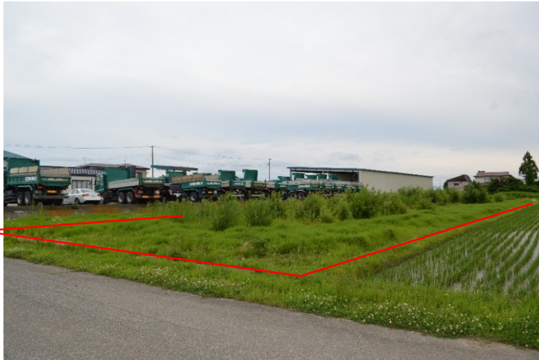
北側市道接道部より撮影