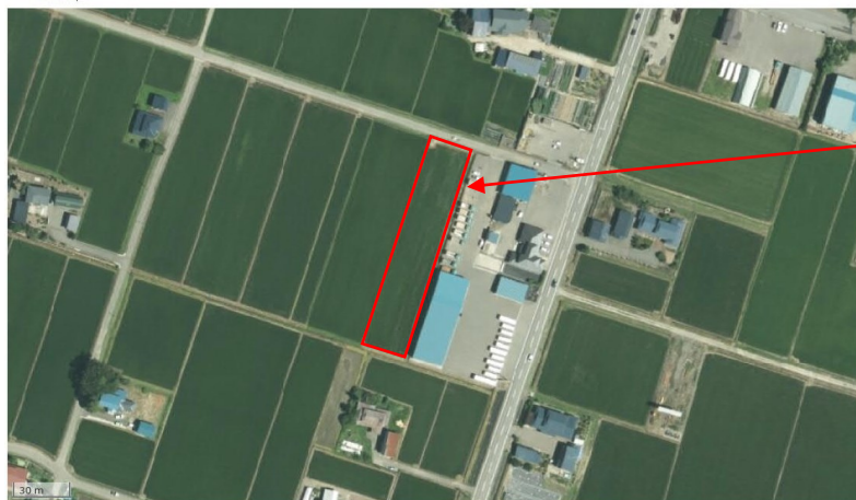
航空写真