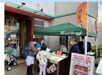
「はこビュン」で輸送したハタハタを東京のアンテナショップで販売