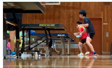
田沢湖スポーツセンターでのスポーツ合宿 (早稲田大学卓球部)