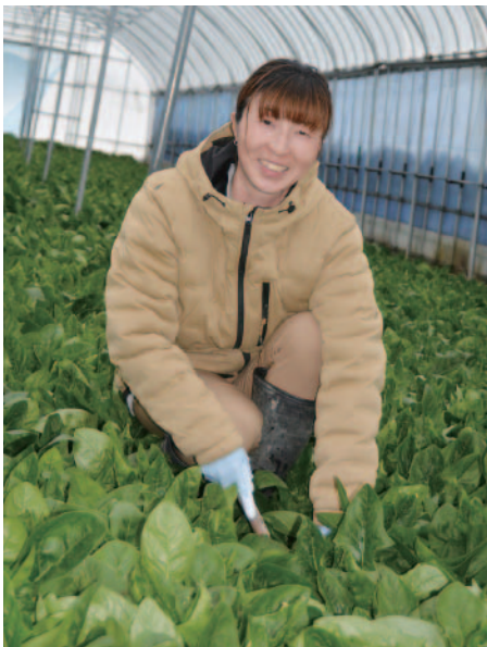
アクが少なく、一番人気のほうれん草

ホームページ: https://akitashop.net / インスタグラム: nakamura_agri