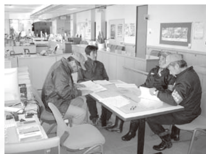
神岡地域での検討会