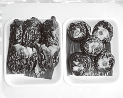
なすの花ずし (右) なすのふかし漬け (左)