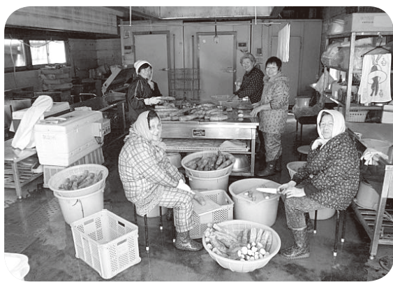
いぶり大根の加工作業

主に漬け込んでいるのがふかしなす漬けといぶり大根です。ふかしなす漬けの原料となるなすは、大仙丸なすという品種で、作業は苗作りから始まります。各部員には、