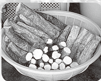
おいしく漬けあがった いぶり大根です