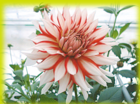
冬一番人気「ラララ」