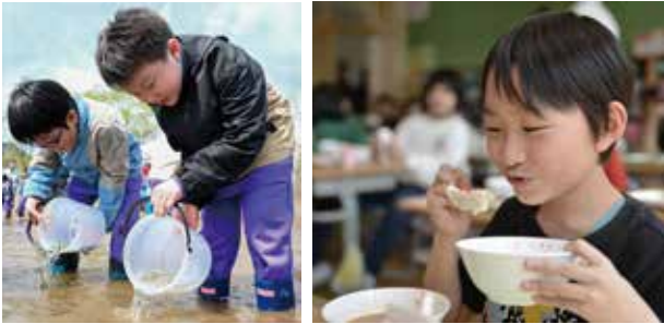
サケ稚魚を放流する児童 サケ餃子を頬張る児童

また、当日は花館のサケを使った給食を初めて提供。雄物川鮭増殖漁業生産組合と(株)長沼商店の協力により、市内の全小・中学校にサケ餃子11,550個が提供されました。