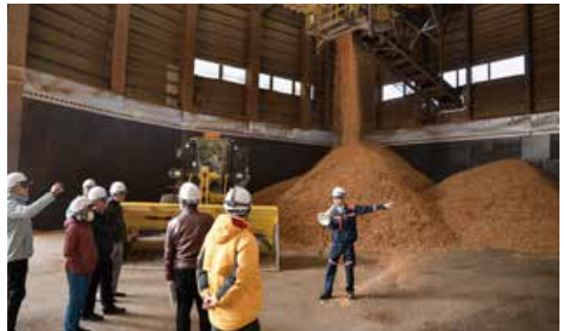
木質バイオマス発電の燃料となるチップ加工現場を視察

この視察・研修は、(一社)あきた地球環境会議とマレーシアサバ州政府が交わした基本合意の一環で実施。環境保全や循環型社会形成、SDGs達成、プラスチックごみの排出が多い同国の意識・行動変容の促進を目指して行われました。局員らは、日本の森林の有効活用やCO2削減効果のほか、製材所で発生し捨てられていた製材端材などを燃料として利用する木質バイオマス発電の仕組み、発電余熱を利用した地域貢献など、SDGsにつながる取り組みを学びました。