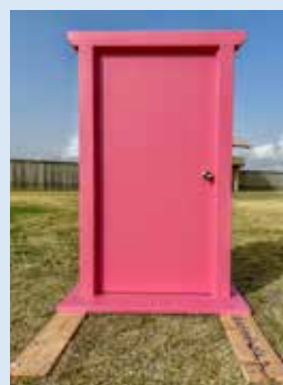
チラッと見えるドアの向こう 「平安時代の史跡、といえど...」

先日、写真の撮り方を聞かれ「見方を変えると見え方が変わる」とアドバイス。「同じものでも見方を変えて撮ると違うものに見えるよ」と4月16日、とある場所に現れたピンク色の扉。誰もが「あつたらいいな」と思ったであろう、あのドアと同じ色・形。その名も「どきさでもドア」▼見慣れたはずの光景も、見方を変えると違った見え方になり、違う空気を感じます。扉の先は、どんな風に見えるのか。皆さんもぜひ、扉の向こう側へ。#どきさでもドア (け)