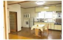
Dinning and Kitchin room