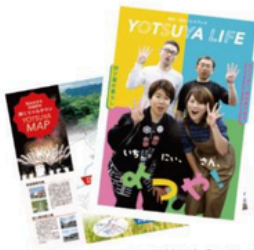
四ツ屋地区ならではの 体験メニューも!

大仙市への移住を考え中の方や 大仙市でのフィールドワークを予定している学生の方のための 生活体験や活動を行える宿泊拠点です!