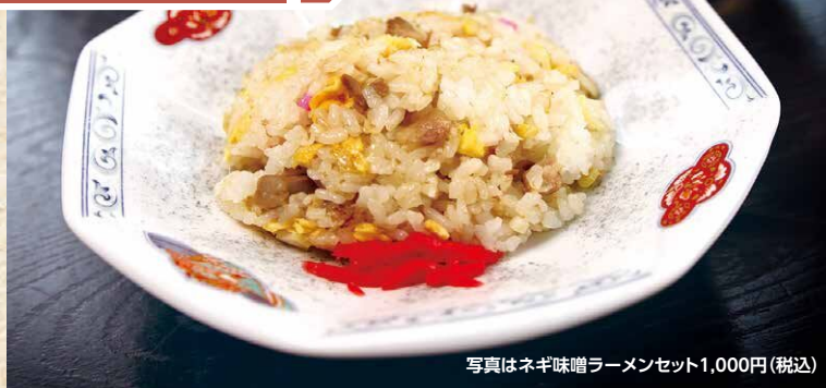
写真はネギ味噌ラーメンセット1,000円(税込)