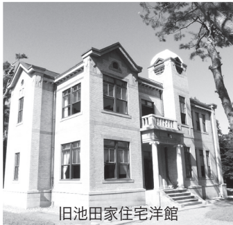
旧池田家住宅洋館