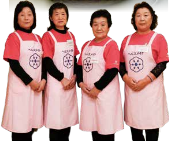
今月のレシピ当番は南外支部です