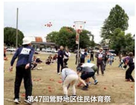
第47回鶯野地区住民体育祭

市 は、「市民と行政との協働のまちづくり」を推進するため、各種補助制度を創設し、市民の皆さんが地域のために取り組む活動を応援しています。