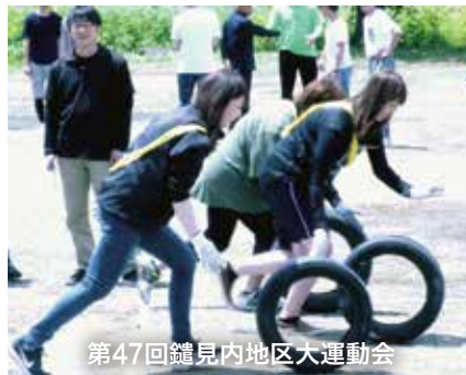
第47回罐見内地区大運動会