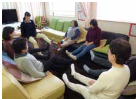
認知症カフェで行った認知症予防体操

※市内には11カ所の認知症カフェがあります。詳細は、最寄りの高齢者あんしん相談室へ問い合わせください。