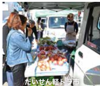
だいせん軽トラ市