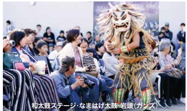
和太鼓ステージ・なまはげ太鼓・岩頭(ガンズ)