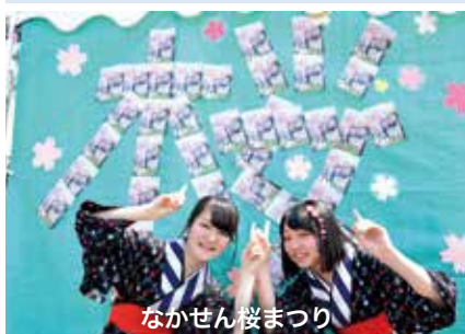
なかせん桜まつり