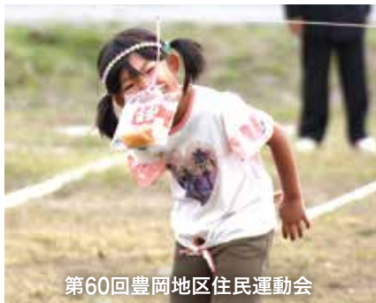
第60回豊岡地区住民運動会

【問い合わせ】まちづくり課 ☎ 0187-63-1111 内線 226 ・各支所地域活性化推進室