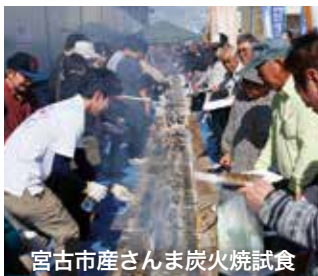
宮古市産さんま炭火焼試食