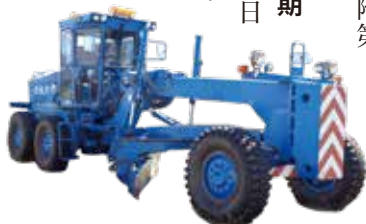
売却物件一覧 (最低売却価格順)