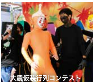
大農仮装行列コンテスト

フェアでは、同広場での新鮮な野菜と農産物加工食品などの販売や、歌や踊りなどの多彩なステージパフォーマンスが行われたほか、花火通り商店街では「だいせん軽トラ市」や飲食ブース「地場産うまいもの食堂」を実施。また、ヒカリオ駐車場横で、宮古市産サンマの炭火焼き試食会なども行われ、会場は収穫の秋を楽しむ多くの人々でにぎわいました。