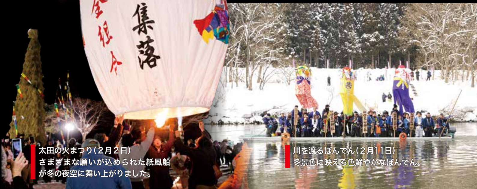
太田の火まつり(2月2日) さまざまな願いが込められた紙風船 が冬の夜空に舞い上がりました。