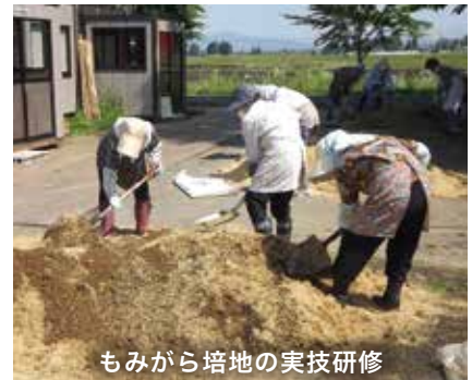
もみから培地の実技研修

市 は、「市民と行政との協働のまちづくり」を推進するため、各種補助制度を創設し、市民の皆さんが地域のために取り組む活動を応援しています。