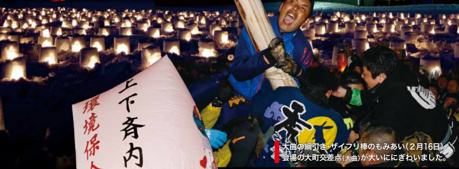
大曲の綱引き・ザイフリ棒のもみあい(2月16日) 会場の大町交差点(大曲)が大いににぎわいました。