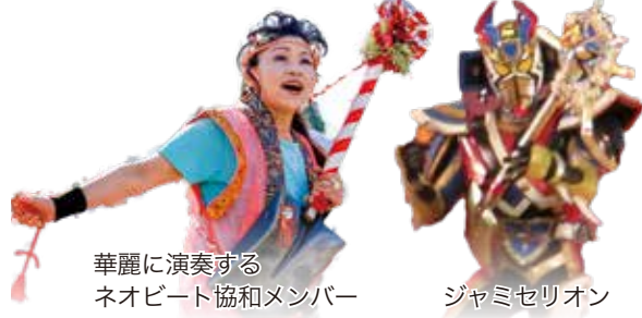
華麗に演奏する ネオビート協和メンバー