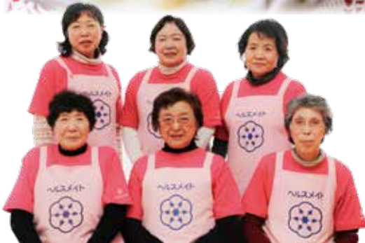
今月のレシピ当番は太田支部です