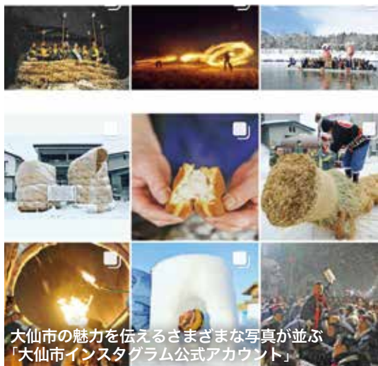
大仙市の魅力を伝えるさまざまな写真が並ぶ「大仙市Instagram公式アカウント」