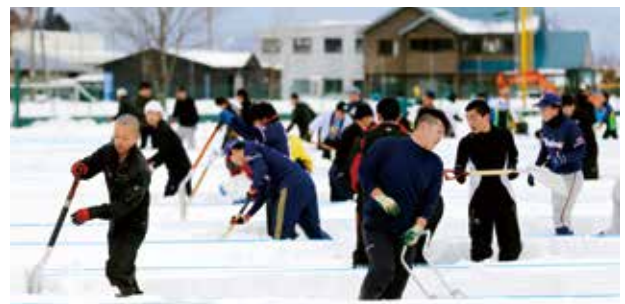
参加者が仲間と協力しながら雪と格闘した「スポーツYUKIYOSE」

今大会には、「グランプリ」と「ペア」の2部門に合計27チームが参加。仲間同士で協力し合いながらスコップとスノーダンプを駆使して競技エリア内の雪寄せを行い、チームごとにその時間を競いました。