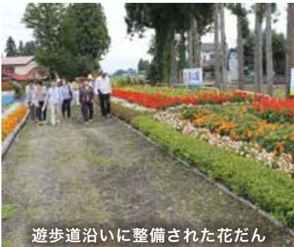
遊歩道沿いに整備された花だん

【問い合わせ】まちづくり課 ☎ 0187-63-1111 内線 226・各支所地域活性化推進室