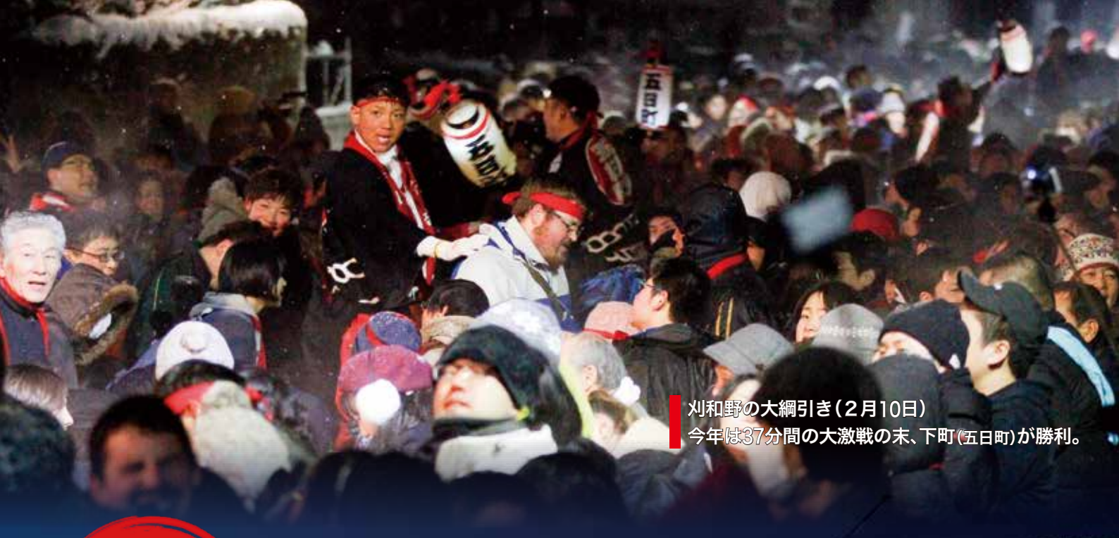
刈和野の大綱引き(2月10日) 今年は37分間の大激戦の末、下町(五日町)が勝利。