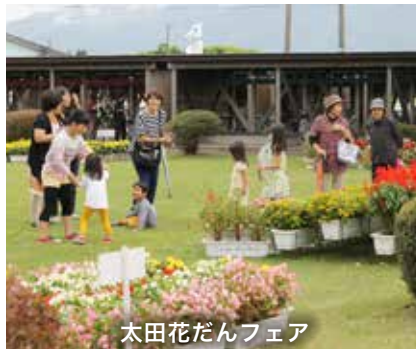
太田花だんフェア