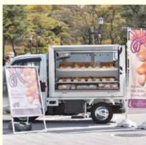
POP UP CASTLE