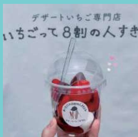
#いちごって8割の人すきよね