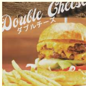
CORNER GATE BURGER