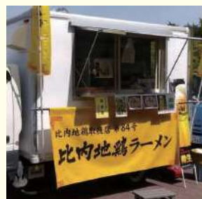
よねちゃんラーメン