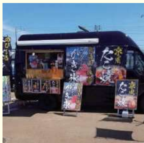
秋田屋台村田舎料理なかや