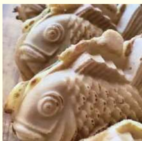
3丁目食堂こむぎちゃん