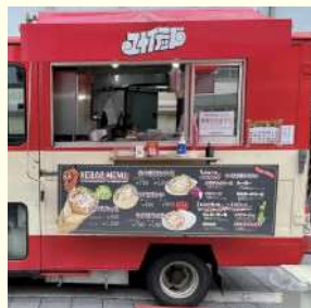
ユナイテッドケバブ