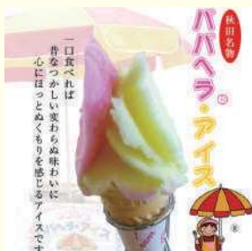
進藤冷菓ハバヘラ