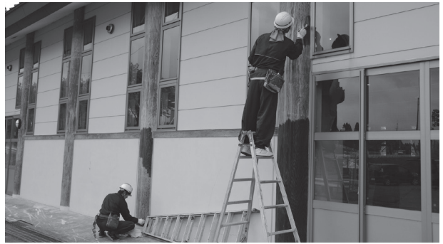
〔写真〕素早く丁寧に塗装を施していく参加者