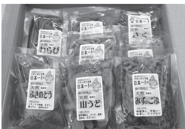
第2回コンクールで最優秀賞を受賞した「秋田の自然が育んだ天然山菜」