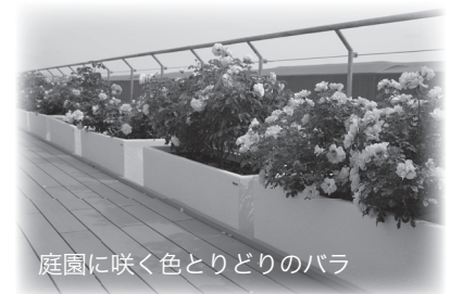
庭園に咲く色とりどりのバラ