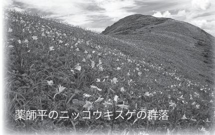
薬師平のニッコウキスゲの群落

◆日時／7月11日(土)午前6時～ ※予備日／7月12日(日) ◆集合場所／真木溪谷小路又駐車場 ◆申込開始／6月25日(木)午前9時～(電話受付のみ)