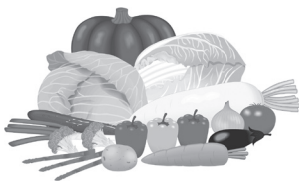
野菜栽培に関する疑問・相談に講師がアドバイスします。