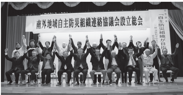
〔写真〕「自助共助」を目標に関係者が気持ち新たに総会

総会では声高らかに設立宣言がなされ、自分たちの地域は自分たちがお互い助け合って守る「自助共助」に向けた組織再編の大きな一歩を踏み出しました。