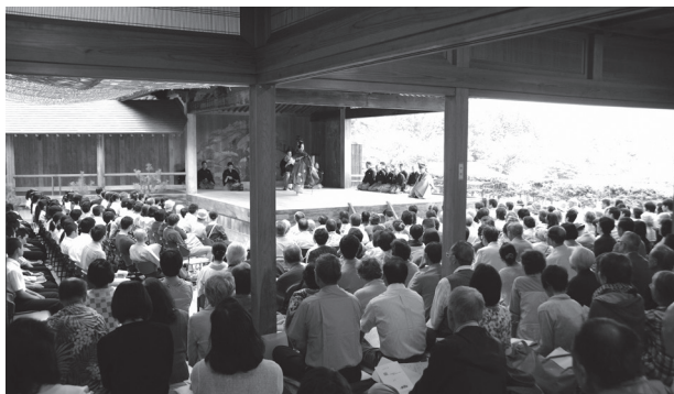
観客を奥深い和の世界にいざなった定期能公演

唐松城能楽殿は、豊かな自然の中、四季の情景を生かし設置された屋外の舞台。協和中学校の生徒を含む招待客や県内外から訪れた約480人の観客は、秋の風を感じながら舞台上に立ち現れた幽玄の世界を心ゆくまで堪能しました。