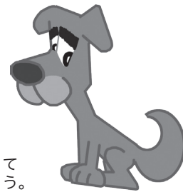
愛犬はマナーを守って飼育しましょう。

犬を家の敷地外に放したり、引き綱を外して公園などで走らせたりする行為は危険です。