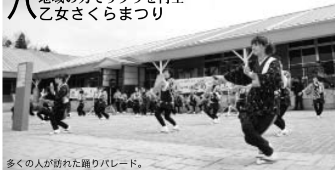
多くの人が訪れた踊りパレード。

八乙女さくらまつりが4月17日から5月5日まで八乙女公園と道の駅なかせんで行われ、5月2日には「踊りパレード」が道の駅なかせんで行われました。