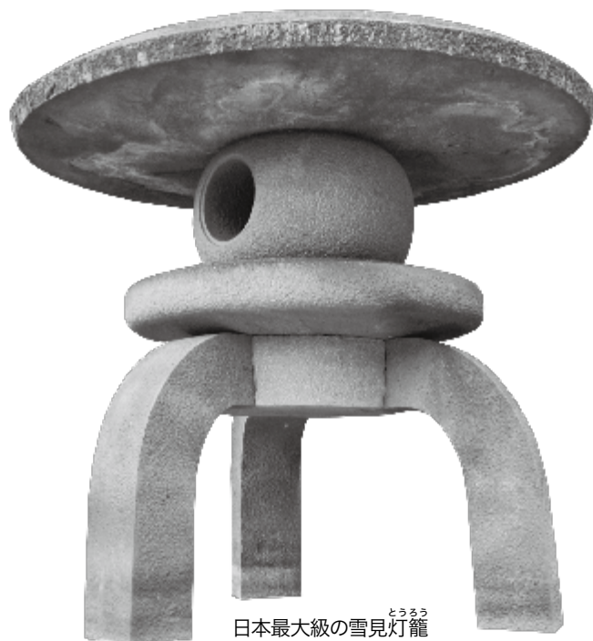
日本最大級の雪見灯籠