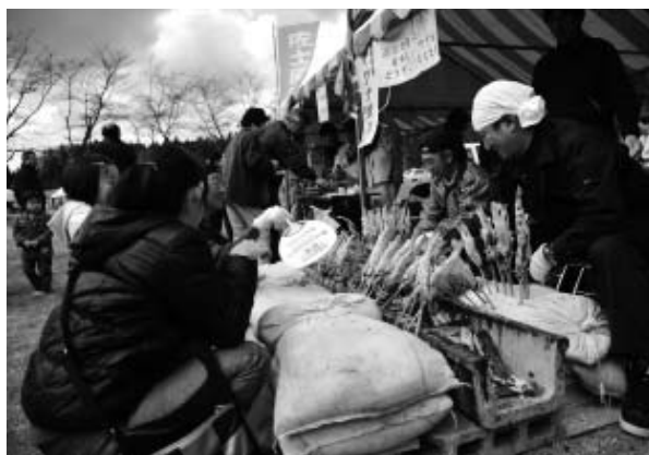
協和地域特産品のイワナの塩焼きも販売されました。