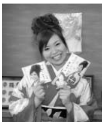
5月26日には、イオン大曲ショッピングセンターで歌を披露する予定です。

「今回の新曲は『どんパン節』をベースにアレンジした演歌。恋心に揺れる若い女性の心境を綴った明るい曲。この曲で元気や明るさを届け、みんなで盛り上げられたら」と意気込みを話しました。