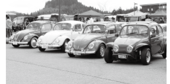
往年の名車が県内外から集まりました。

このイベントは今年で9回目。当日は、県内外から車・バイク合わせて約100台、それぞれのオーナーと多くの見物客でにぎわいました。