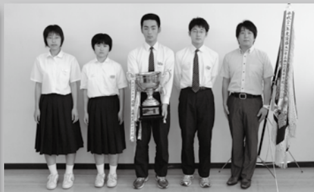
2 西仙北東中学校バドミントン部