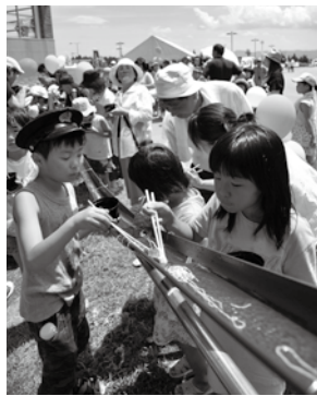
流しそうめん大会では、終始にぎわいを見せていました。

6月30日に開通した市道黒森山線の開通記念イベントが7月18日、西仙北ぬく森温泉ユメリアで行われました。