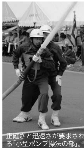
正確さと迅速さが要求される「小型ポンプ操法の部」。

「秋田県消防協会大仙市仙北市美郷町支部消防訓練大会」が7月17日、大曲の雄物川河川緑地公園で行われ、地区予選代表の14チームが出場しました。