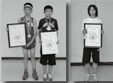
1 太田北・花館・中仙小学校