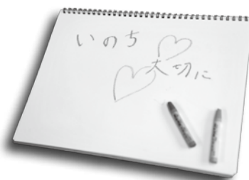
ポスターをとおして「命の大切さ」について考えてみましょう。