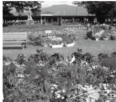
心を込めて作られた色鮮やかな花だんをぜひご覧ください。