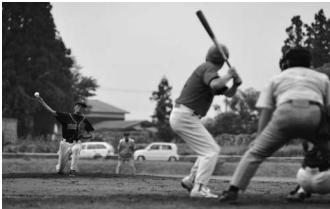
榎岡クラブは、19年越しの初勝利を挙げました。

決勝は、秋田東部クラブ(秋田市)と秋銀クラブ(同)の対決。秋銀クラブ2点リードで迎えた4回、東部クラブが一挙4点を挙げ逆転。最終回の5回、秋銀クラブが1点を返し、一打サヨナラのチャンスを迎えるも好守に阻まれゲームセット。東部クラブが初優勝を飾りました。