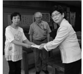
同協会からは、毎年チャリティ民謡の収益金の一部を寄贈いただいています。

同協会は、民謡民舞を通じた福祉活動のほか、伝統文化の保存・普及も行っています。寄贈いただいた収益金は、教育文化振興基金として伝統文化の継承などに利用させていただく予定です。