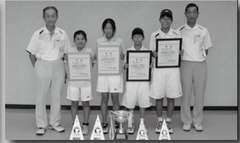
2 大曲ジュニアソフトテニスクラブ