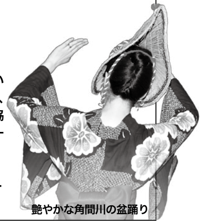
艶やかな角間川の盆踊り

西馬音内(羽後町)、毛馬内(鹿角市)、一日市(八郎潟町)、角間川の盆踊りが勢ぞろい!! 艶やかで華麗な舞をお楽しみください。