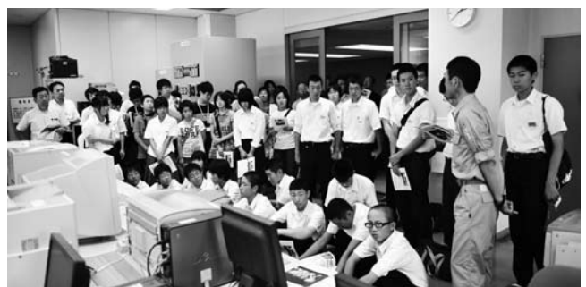
今年のサミットのテーマは「水」。生活水の処理法・供給方法などについて、下水処理施設や浄水場を見学しながら説明を受けました。

【小型ポンプ操法の部】▼優勝＝仙北市第4分団▼準優勝＝仙北市第8分団第2班▼第3位＝美郷町第2分団【規律訓練の部】▼優勝＝大仙市大曲支団▼準優勝＝大仙市仙北支団▼第3位＝仙北市第8分団