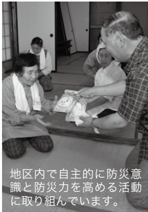
地区内で自主的に防災意識と防災力を高める活動に取り組んでいます。

また、当日は大曲仙北市町村圏組合消防署西分署員による防災講習会を実施。警報器の設置方法や消火器の使用方法を学び、万が一の際の対処方法を確認しました。