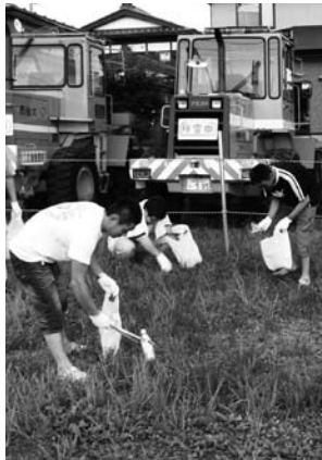
地域への感謝とごみのポイ捨てのない街への願いを込めて清掃活動を行いました。

商工会法施行50周年の全国統一事業として、商工会を支援くださった地域のみなさんへ感謝を込め、全国の商工会青年部員が同日・同時刻(午後6時)に地域の清掃活動を実施。商工会青年部員や事務局職員約30人が、清掃活動に汗を流しました。