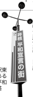
大曲駅東口にある非核平和宣言塔