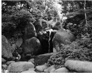
白亜の洋館(写真左)と今回初公開された庭園西部の滝。

国指定名勝に指定されている同庭園。県外からの来客が多い「大曲の花火」の翌日に特別公開を行うことで、県外の方々や帰省している方々に歴史的・文化的に価値の高い庭園をピーアールしようと昨年からの実施しています。