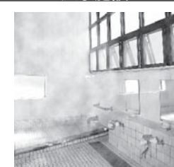
八乙女温泉「さくら荘」