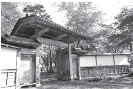
弘田分家庭園正門。常時自由見学できます。美しい紅葉をご覧ください。

◆写真撮影／個人での写真撮影は可能ですが、三脚の使用・商用目的の撮影はできません。