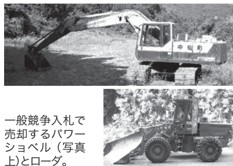
一般競争入札で売却するショベルとローダ。