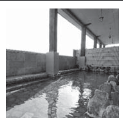
史跡の里交流プラザ「柵の湯」