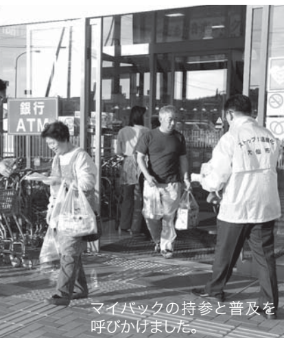
マイバックの持参と普及を呼びかけました。