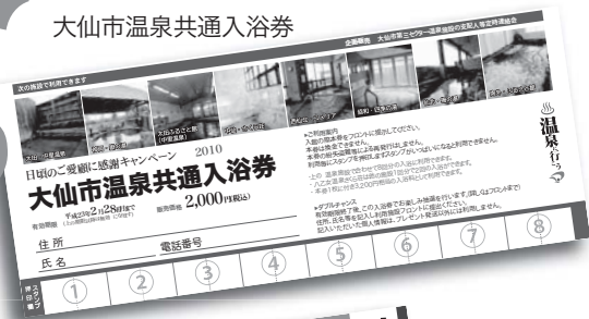
大仙市温泉共通入浴券