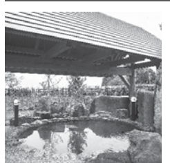
かみおか温泉「獄の湯」