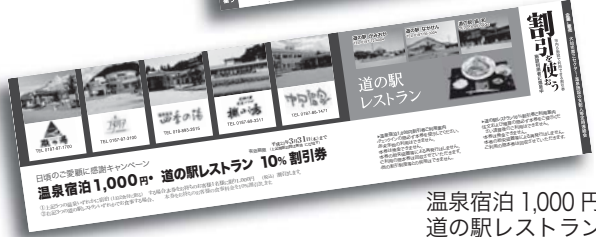
温泉宿泊1,000円割引券 道の駅レストラン10%割引券