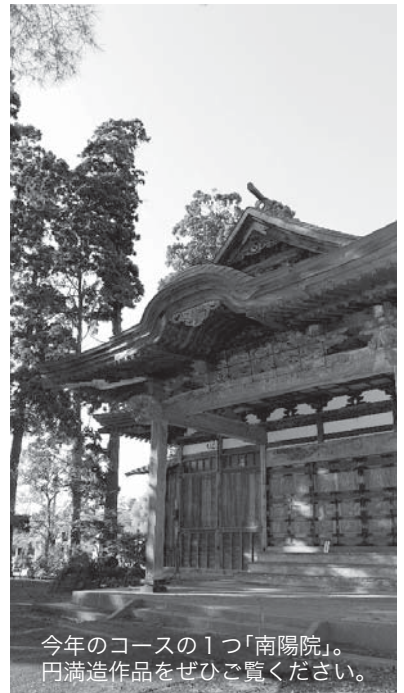
今年のコースの1つ「南陽院」。円満造作品をぜひご覧ください。