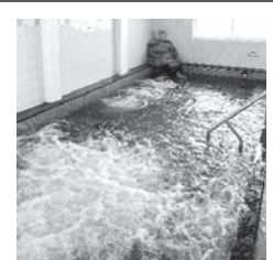
松木田温泉「南外ふるさと館」