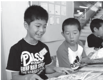
子どもたちのために児童書の寄贈をお願いします。

◆寄贈を募集する本／ 絵本、昔話、童話、学習まんが、児童文学、図鑑、調べ学習用図書(国際理解・情報・環境・福祉・健康)、地域の伝統や文化に関するもの