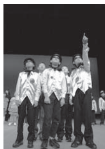
子どもたちの頑張りをぜひご覧ください