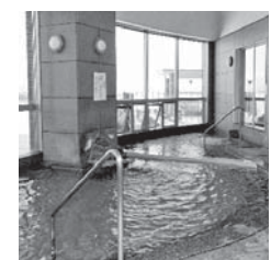
西仙北ぬく森温泉「ユメリア」