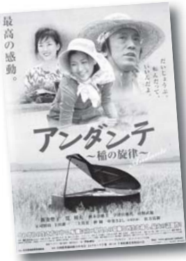
入場無料で感動の話題作をぜひご覧ください