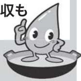
大仙市廃油回収キャラクター ハイユリン

環境保全と再資源化推進のため、最寄りの廃食用油回収拠点を利用ください。 ※大曲の廃食用油回収拠点に「はびねす大仙」(大曲地域幸町)が追加されましたので、活用ください。