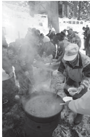
大平山山頂から御来光を眺める参加者(写真右) 下山後、雑煮をほお張りながら体を温める

その後、参加者は薬師神社まで下山。会員が作った温かい雑煮に舌鼓を打ちながら新春を祝いました。