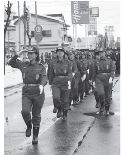
さっそうと行進する女性消防団員（写真上）力強い行進で栗林市長等の観閲を受けた消防団員（写真左・西仙北支団）