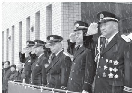
栗林次美市長（写真中央）を始め、草薮忠誠消防団長、保坂進仙北地域振興局長、高橋庄孝消防長、菊地孝大仙警察署長（写真右から順）が行進を観閲