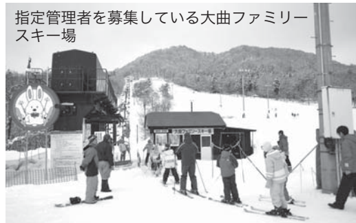
指定管理者を募集している大曲ファミリースキー場

指定管理者は、申請があった事業者の中から指定管理者選定委員会が候補団体を選定。市議会の議決を経て正式に決定します。なお、候補団体は6月下旬ごろに決定し、決定した団体には文書でお知らせします。