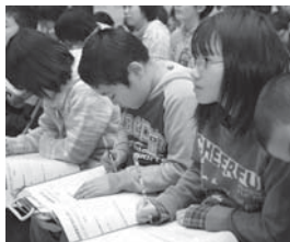
熱心にメモを取りながら中学生のプレゼンテーションを聴く小学生