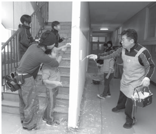
児童・保護者・教師が一緒になり 校舎に夢を描く準備が進む