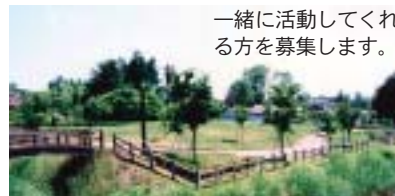
一緒に活動してくれる方を募集します。