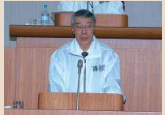
平成19年第1回市議会定例会で 施政方針演説を行う栗林市長。 (2月27日本会議初日)