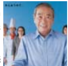
早めの手続きをお願いします。

労働保険（労災保険・雇用保険）の保険料は、事業主が年度当初に概算で申告・納付し、翌年度当初に確定申告の上、精算することになっています。19 年度の申告・納付期限は 5 月 21 日（月）ですので、お早めの手続きをお願いします。詳しくは問い合わせください。