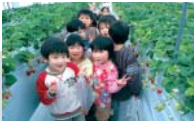
園児たちは、おいしいイチゴをほおぼりながら収穫の楽しさを体験しました。

今後は収穫体験の対象を広げ、たくさん子どもたちに農業の素晴らしさを体験してもらおう予定です。