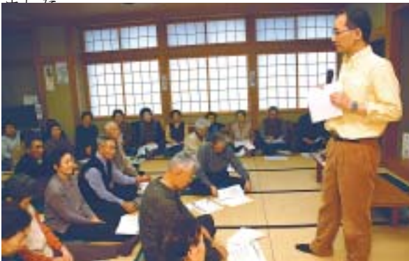
「老化を防止するには生活の中にある種の緊張感が必要」と話す熊谷先生。地域のお年寄りが老化予防について学びました。

熊谷先生は、「高齢者の多い地域では老化が甘く受け入れられる傾向にあり、そのような油断は老化を進行させる。老化を防止するには生活の中にある種の緊張感が必要。介護予防すること自体が社会に貢献しているのだから、食生活の改善を通じて老化を制御しましょう」と参加者に呼びかけました。