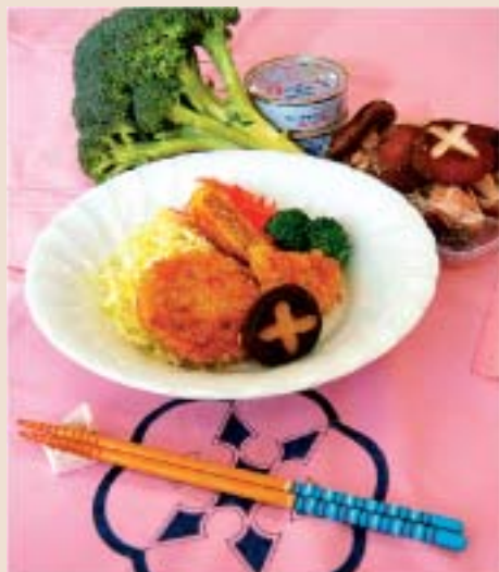
春キャベツの 甘みがギュッと ツナと野菜のメンチ