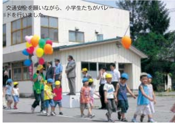
交通安全を願いながら、小学生たちがパレードを行いました。

また、地域の小・中学生、高校生から募集した交通安全作品コンクール表彰式も行われ、作文の部で最優秀賞に輝いた生徒が作品を朗読。交通事故のない安全で住みよいまちづくりを築くことを誓いました。