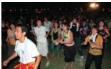
練習に参加し、ドンパン祭りと一緒に踊りませんか。