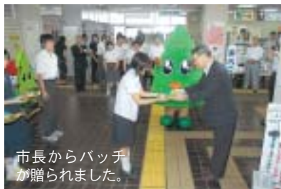
市長からバッチ が贈られました。

今回寄贈されたバッチは、9月29日から行われる「わか杉国体」を盛り上げるために作成されたもので、国体に参加する関係者や小・中学生、高校生などに贈られます。