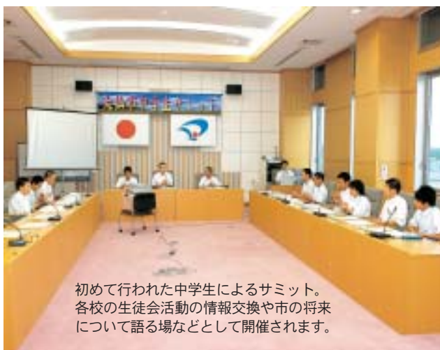
初めて行われた中学生によるサミット。 各校の生徒会活動の情報交換や市の将来 について語る場などとして開催されます。

4月から「あいさつの花を咲かそう」をテーマに取り組んできた「おはようプロジェクト」のさらなるあいさつの向上を目指し、各中学校が制作した15秒コマーシャルを8月中旬から15本放送する予定です。詳しい放送日時等が決まり次第、広報等で紹介します。