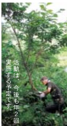
活動は、今後毎年2回 実施する予定です。

6月22日、中仙地域の有志で結成される土友会のメンバーが、八乙女山で桜の管理作業を行いました。春には桜で覆われる八乙女山ですが、最近では木の老化がすすんだため、桜の手入れが不可欠になっています。