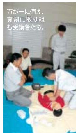
万が一に備え、真剣に取り組む受講者たち。

6月25日、大曲消防署東分署で「平成19年度太田支部スポーツ少年団指導者協議会・保護者連絡協議会」が行われ、指導者や保護者の方など35人が参加しました。