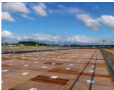
昨年の大会の栈敷席。みなさんのお越しをお待ちしています。