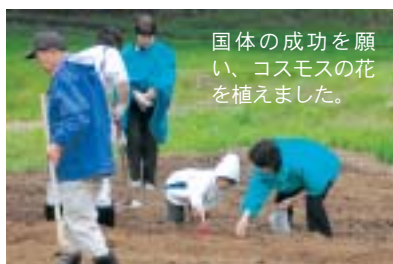
国体の成功を願い、コスモスの花を植えました。