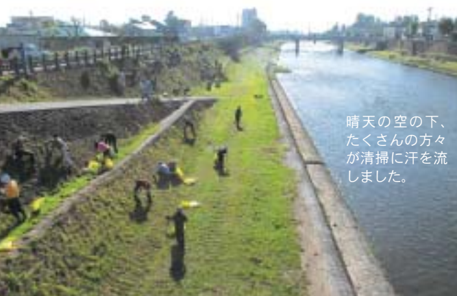
晴天の空の下、 たくさんの方が 清掃に汗を流 しました。