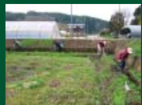
「水路の保全（泥あげ）」 大向坊村地区環境保全委員会（南外）