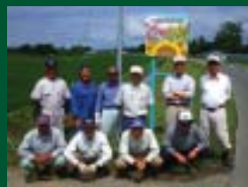
「看板の設置」 蒲地区農業環境保全会（神岡） 各地に看板を設置し、農村地域のピーアール活動を行っています。