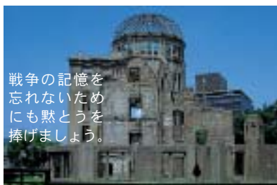
戦争の記憶を 忘れないため にも黙とうを 捧げましょう。