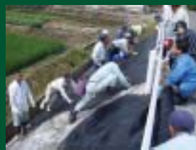
「カバープランツの植栽」 横塚地区環境保全グループ（仙北）