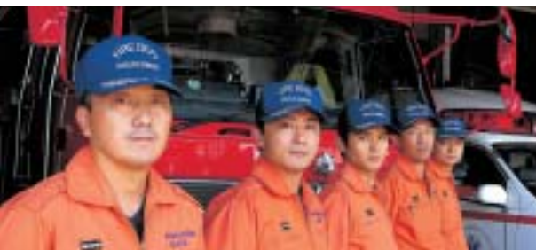
大曲消防署のレスキュー隊員は16人。3交代で24時間住民の安全と財産を守る。

い訓練を重ね、持ち前の身体能力により磨きをかけてきた。「体を動かし人の役に立ちたい」と思い、消防の道を選びました。救助の技術が身に付くほど、どんな状況でも人命救助を果たしたいといった欲が出てきます。「極めたい」という願望が強いのもかもしれません。一つとして同じ災害現場はありません。あらゆる状況に対応できるように訓練しなければならぬと思います」と妥協を許さない。また、この種目に挑戦して8年目。初の全国大会出場を果たし、「県大会での記録には満足していませんが、集中力を高め無心で入賞、そして上位に食い込みたい」と抱負を語る。 大曲消防署の特別救助隊員は16人。オレンジ色のユニフォームの隊員たちは人命救助のプロとして日々研鑽を積む。高度化する救助技術を習得するためには、日々の基本的技術の錬磨はもちろんのこと、体力、精神力を養うことが不可欠だ。 レスキュー隊員としての使命と誇りを胸に、日夜地域住民の安全と財産を守る。