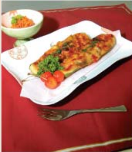
パーティーの前菜としても ぴったり ズッキーニのオープン焼き