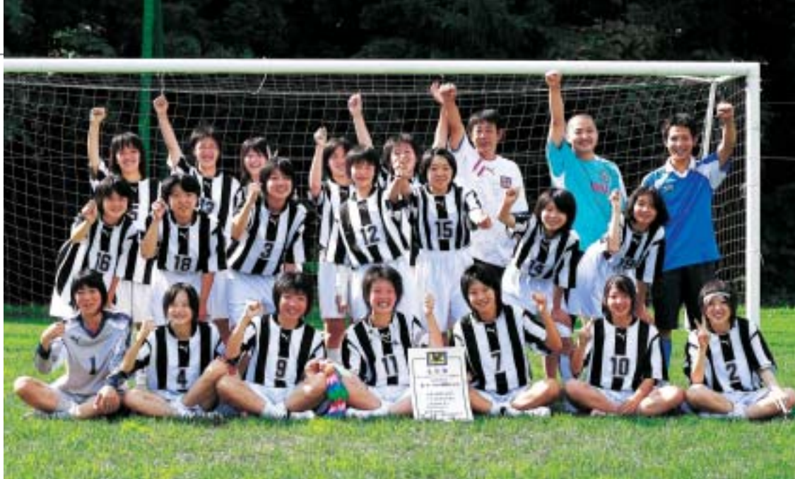
優勝を喜ぶ、リベルテ神岡女子サッカーチームの選手たち。