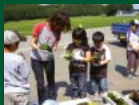
「子どもたちと花の植栽」 皆別地区環境を守る会（西仙北） 子ども会と連携してプランターへ花を植栽。地域の繋がりや連携を深めています。