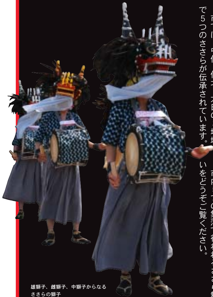
雄獅子、雌獅子、中獅子からなるささらの獅子