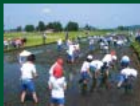
「小学生の田植え体験」 太田集落環境保全組合（太田）

※今回紹介したほかにも、たくさんの組織・団体が農村の景観整備・基盤整備に取り組んでいます。