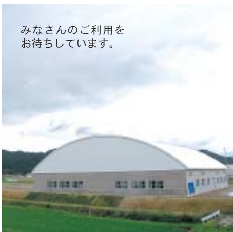
みなさんのご利用をお待ちしています。