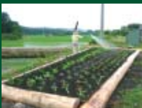
「市道の景観向上」 上荒川地域資源保全隊（協和） 農道沿いに花を植え、景観向上と周辺部の管理を行っています。