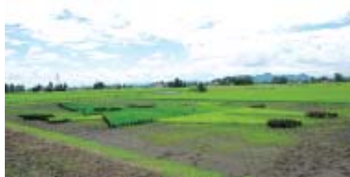
田んぼの中に スギッチ発見

中仙地域の清水地区を車で通っていると田んぼの中にスギッチ発見。この日は天気良かったせいか青空の下でスギッチが田んぼに寝転がっているように見えました。秋田わか杉国体までもう少しですね。