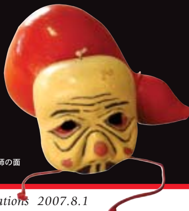
ささらの道化師の面