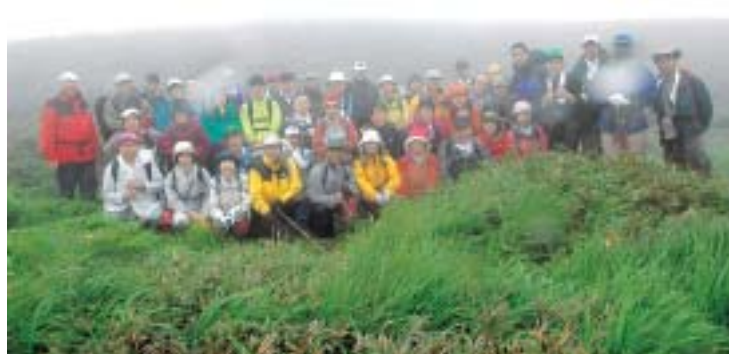
視界は良くありませんでしたが、薬師平で記念撮影を行いました。