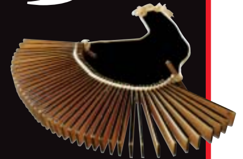
道化師が持つ楽器「ササラ」。

ささら舞いは、大型の獅子頭3頭が五穀豊穰、天下泰平を祈願してお盆に舞う獅子踊りです。「ささら」の名は道化師が持つ楽器のササラが由来で、慶長7年、佐竹公が秋田へお国替えの時に伝えられた関東系と、戸沢氏が南部半石から伝えた南部系のささらがあると言われています。