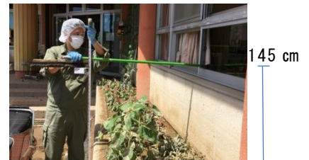
29年豪雨での保育園の浸水深度は145cm、床上80cmまで水没しました。(写真は浸水3日後)

大仙市アーカイブズでは、平成29年7月の豪雨災害で被災した淀川保育園の資料レスキュー作業に協力させていただきました。当時の作業を例に、資料が泥水に浸かってしまったときの応急処置を紹介します。