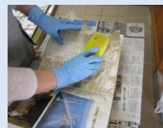
汚れを取る (台所用スポンジ)