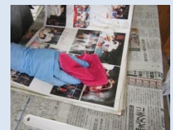
仕上げ (マイクロファイバークロス)