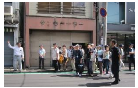
偶然出会った？商店街の会長さんが案内役に。商店街の魅力を紹介していただきました。

街歩きでは、当時の写真や地図と現在を比較したり、思い出を語り合ったりしながら、歴史を知ることで見えてくる地域の魅力探しを楽しみました。