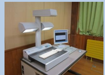
資料を真上から撮影

高階家から史料を借用してデジタル化し、画像データを地域の共有財産として活用させていただくことになりました。公開に向けて目録作成を行っています。