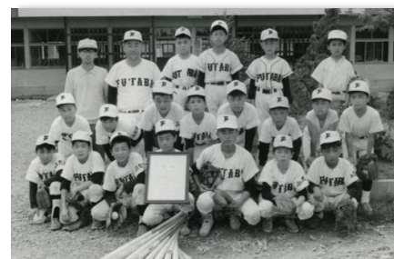
部活動の思い出は一生の宝物