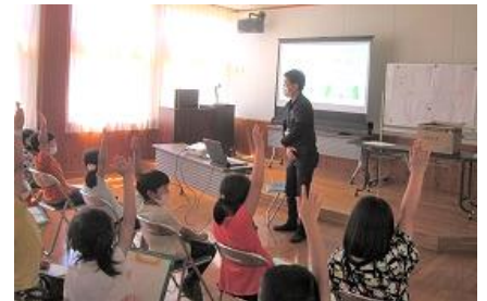
職員が出題したクイズに 元気いっぱい回答

最後に戦国時代の書状を見てもらいました。400年以上前の戦国時代の資料が残っていることにびっくり。ふるさとの歴史に興味を持つきっかけになればうれしいです。