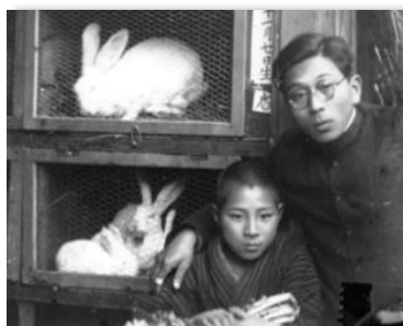
生き物の飼育も教育の一環でした（寺館小）