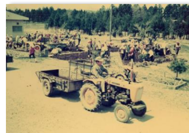
P T Aの奉仕活動による学校花壇（昭48）