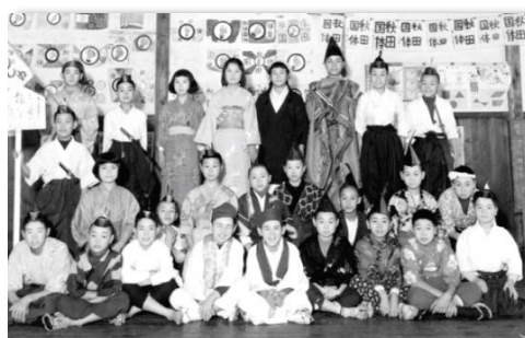
学芸会の記念に（昭36・強首小）