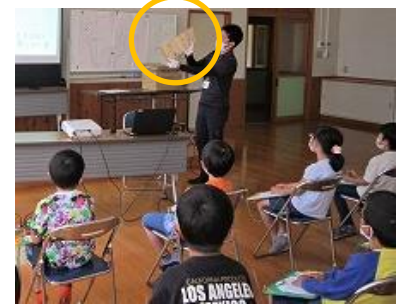
戦国時代の書状に驚き