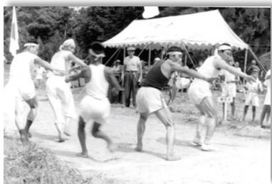
地域のみなが参加した運動会（昭36・強首小）