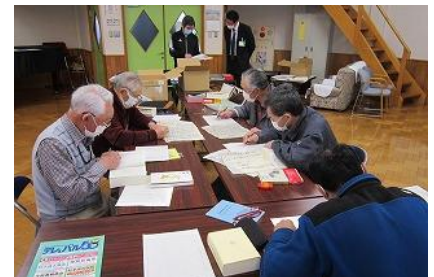
南外古文書を楽しむ会