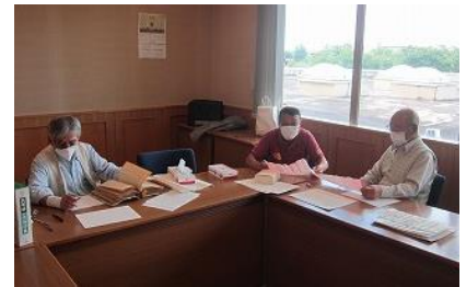
古文書調査会（西仙北）

資料整理のお手伝いに御協力いただける方、興味のある方は、ぜひアーカイブズに御連絡ください。