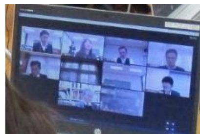
オンライン会議の様子

当館の諮問機関として、専門的見地から指導や助言をいただく大仙市アーカイブズ運営審議会が、2月14日、オンライン形式で開催されました。令和5年度の活動報告と、来年度の事業計画について、委員の皆様から貴重な御意見や御助言をいただきました。