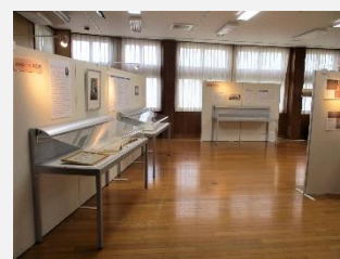
令和5年度企画展の様子