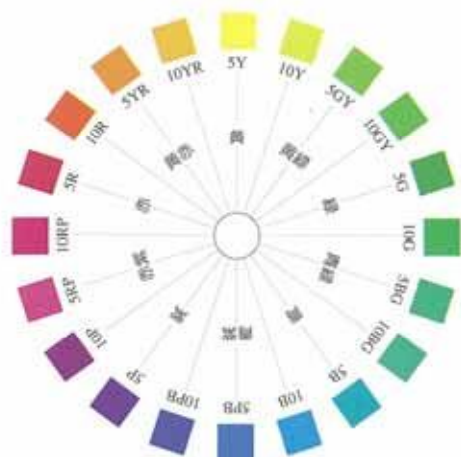
図-2 マンセル20色相環 表紙の図-1を真上から見たときの色の並び

この表示方法はなじみやすいものですが、同じ色名でも個人によって少しずつ違う色を思い描いていることもあり、誤解を招くことがあります。