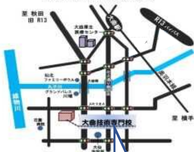
秋田県立大曲技術専門校の案内図