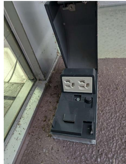
※外付コンセント設置箇所

⑥出店による事故や苦情等のトラブルは出店者の責任において処理すること。また、トラブルが発生した場合は、速やかに市へ報告すること。