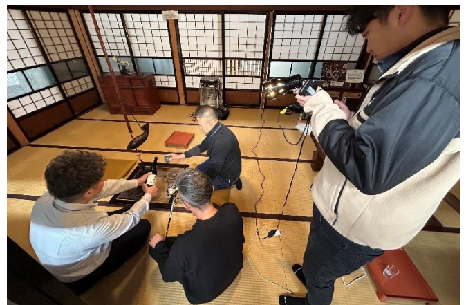
古民家での市PR動画撮影（メイキング風景）