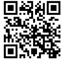
大仙市地域おこし協力隊募集ページ

〒014-8601 秋田県大仙市大曲花園町1番1号 大仙市役所企画部広報広聴課「地域おこし協力隊」担当 TEL: 0187-63-1111 (内線274) E-mail: kouhou@city.daisen.lg.jp