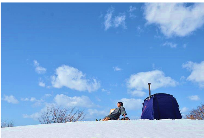
雪上で行ったロケーションサウナ