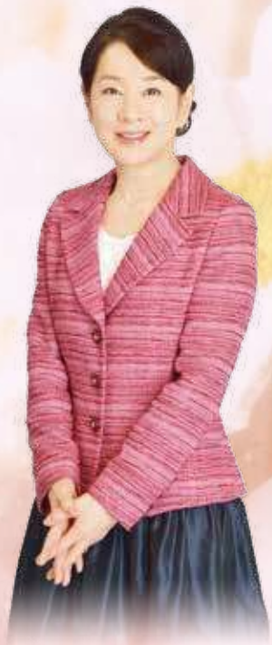
選手の皆さん憧れの大女優