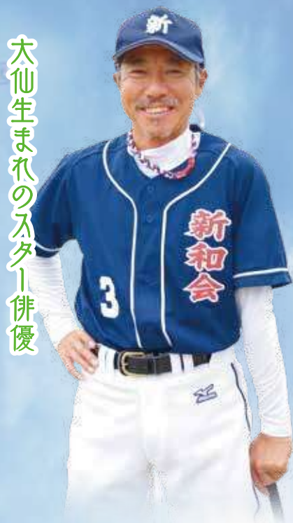
太仙生まれのスター俳優