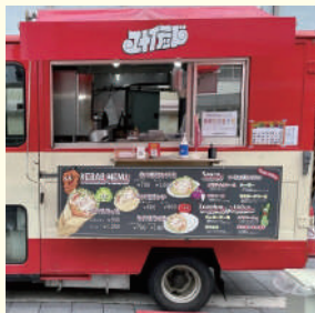
ユナイテッドケバブ