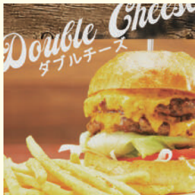
CORNER GATE BURGER