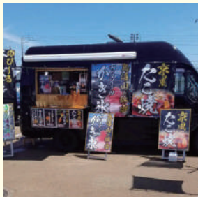
秋田屋台村田舎料理なかや