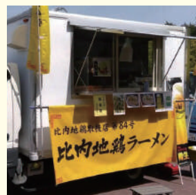
よねちゃんラーメン