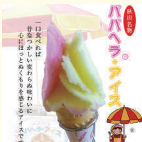
進藤冷菓ハバヘラ