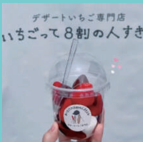
#いちごって8割の人好きよね