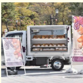
POP UP CASTLE