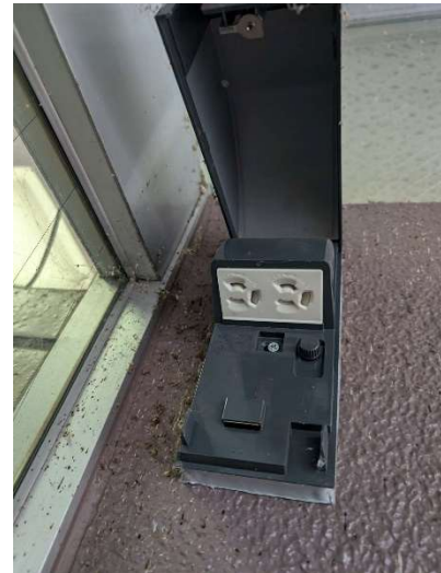
※外付コンセント設置箇所

⑥出店による事故や苦情等のトラブルは出店者の責任において処理すること。また、トラブルが発生した場合は、速やかに市へ報告すること。