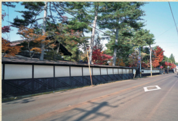
本通りの旧地主屋敷群(荒川家周辺)

近世の在方商人から、近代の在村地主へと発展した在地郷町の変遷を伝える商人町(地主町)ゾーン。 近代において大規模な地主屋敷群が形成されました。周辺は「本通り」と呼ばれ、現在も周辺には短冊状地割の商店・民家が多数残っています。