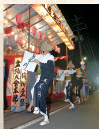
市指定無形民俗文化財 角間川盆踊り