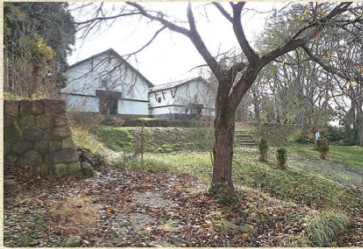
河港跡に現存する浜倉2棟(明治5年建築)

河港の遺構や浜蔵2棟が残し、付近は親水公園として整備されています。雄物川舟運の歴史を伝える「河港のまじ角間川」の交流の拠点となっています。