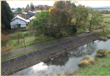
角間川浜倉と角間川河港(親水公園)