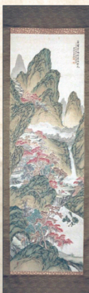
市指定有形文化財 松岡白石作品群