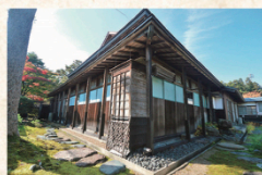
国登録有形文化財 日本郷家住宅