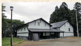
角間川浜蔵(未指定)