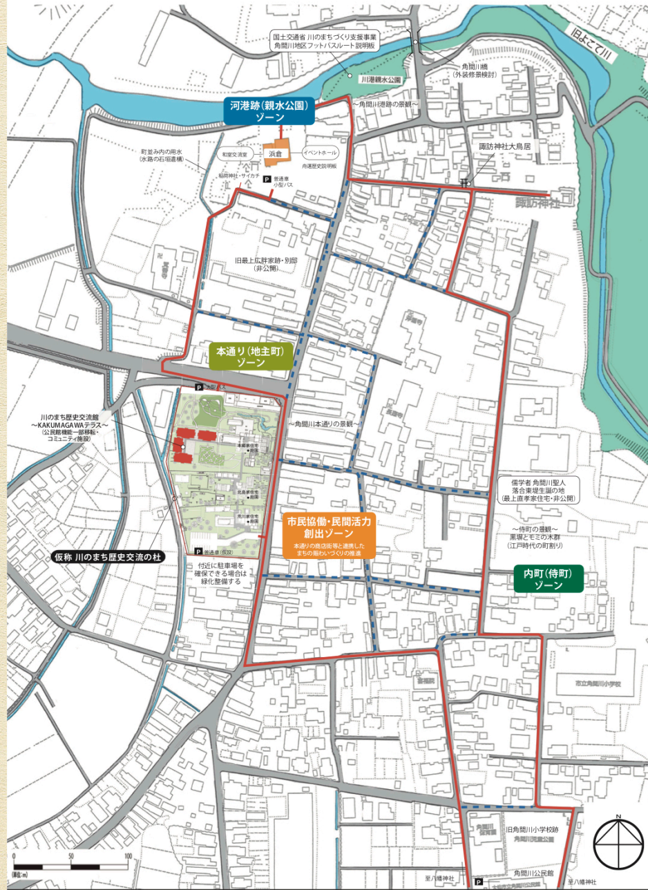
河港のまじ角間川・歴史まちづくり事業