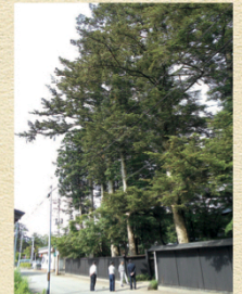
内町に残る 旧侍屋敷のモミの木群と黒塚