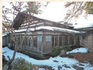
上: 旧荒川家住宅・主屋(座敷付近)