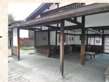
左: 改修イメージ(例/弘前市内まめめぐり休憩所) 下: 旧荒川家住宅立面図(本通り側)