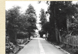
往時の内町(昭和50年代か)