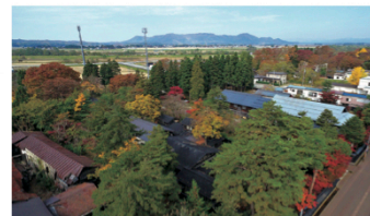
手前から荒川家・北島家・本郷家