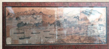
市指定有形文化財 紙本角間川港の図