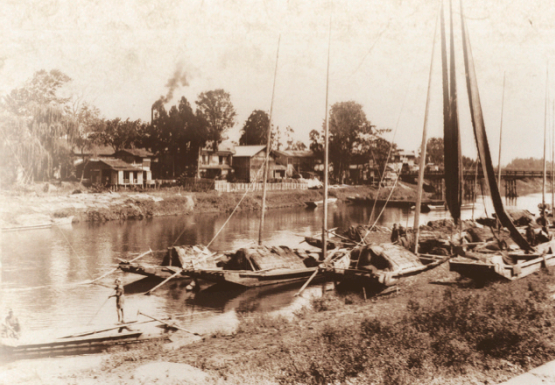
角間川橋を望む角間川港の河岸(明治期)

角間川の近世における内町(侍町)と外町(商人町)といった町割り、大仙市内では特徴的であり、現在でも内町には、侍町の特徴を表す鉤型の通りが遺っています。