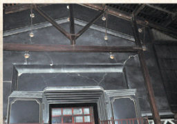
旧荒川家住宅 内蔵の蔵前(黒漆喰)と、さや飾り

地方史の資料などには、本郷家・北島家・荒川家(本家・分家)・最上家・地主家を総じて「角間川六人衆」と称する記述も見られます。